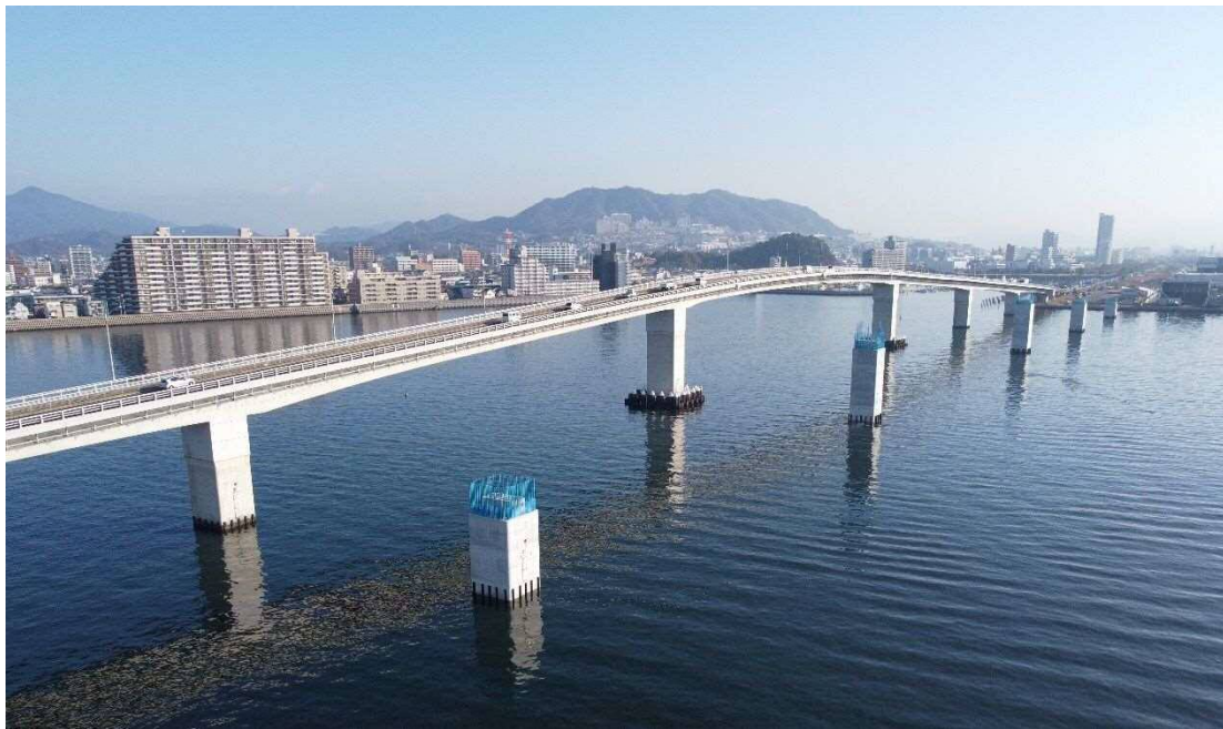
海上部の橋脚工事の状況 (3/3)

広島はつかいち大橋東詰交差点から広島はつかいち大橋西詰交差点西までの1.3kmについて、令和1桁年代半ばの完成を目指し、平成29年10月より施工中です。現在、陸上部の道路舗装工事を実施中です。