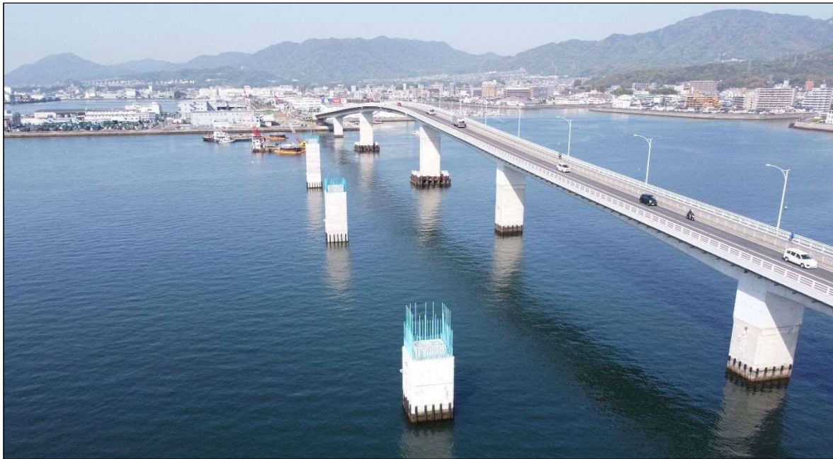
海上部の橋脚工事の状況 (4/22)

広島はつかいち大橋東詰交差点から広島はつかいち大橋西詰交差点西までの1.3kmについて、令和1桁年代半ばの完成を目指し、平成29年10月より施工中です。現在、海上部の最後の橋脚工事を実施中です。