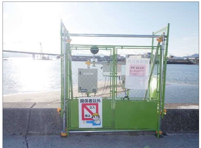
○ 騒音振動計設置して 常時監視を行っています