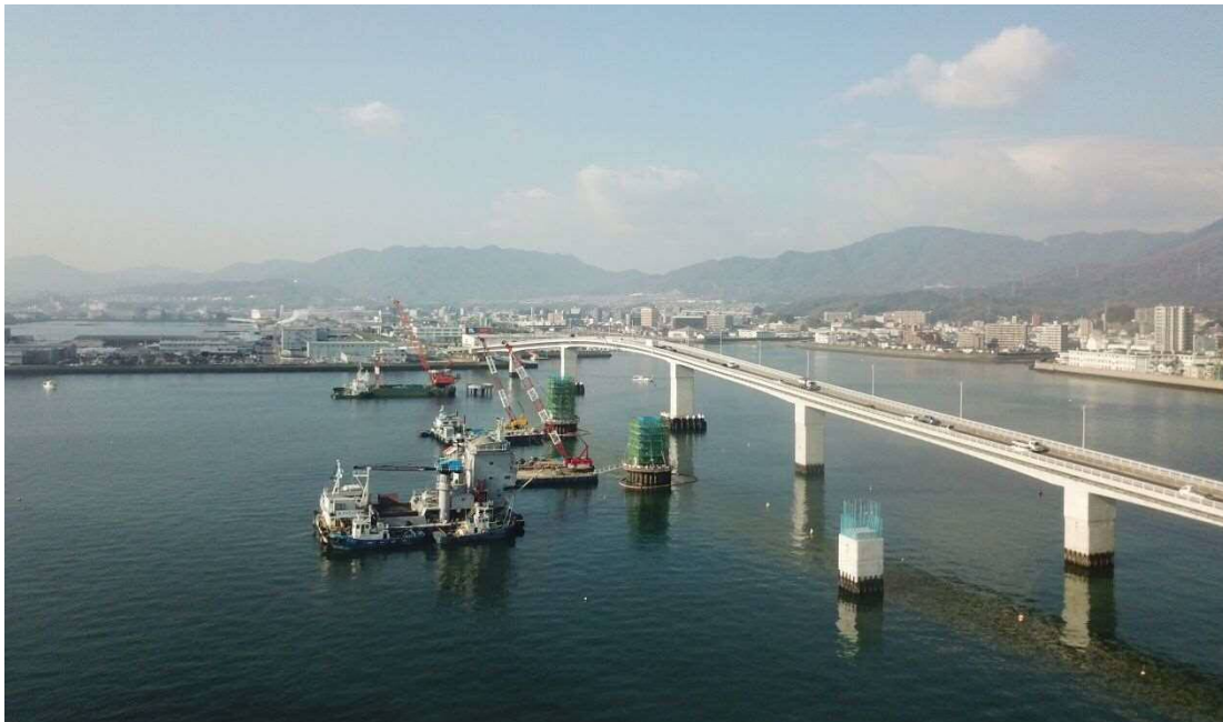
海上部の橋脚工事の状況 (12/25)

広島はつかいち大橋東詰交差点から広島はつかいち大橋西詰交差点西までの1.3kmについて、令和1桁年代半ばの完成を目指し、平成29年10月より施工中です。現在、海上部の橋脚工事を実施中です。