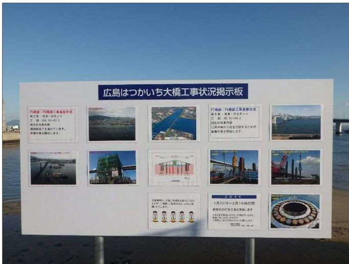
○ 工事に関する情報コーナー 設置しています