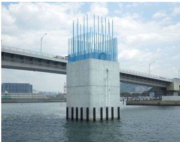
○ P4橋脚は完成しました (次は上部工と合わせて工事をします)