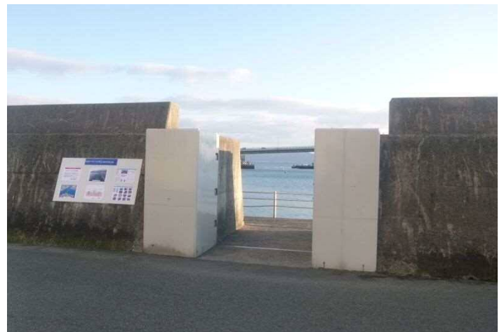
○ 工事に関する情報コーナー を2箇所設置しています