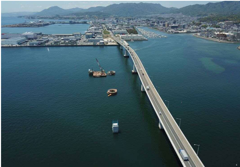
海上部の橋脚工事の状況 (5/8)

広島はつかいち大橋東詰交差点から広島はつかいち大橋西詰交差点西までの1.3kmについて、令和1桁年代半ばの完成を目指し、平成29年10月より施工中です。現在、海上部の橋脚工事を実施中です。