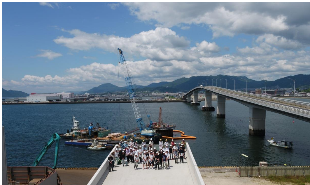
広島工業大学 工学部 環境土木工学科（3年生）のみなさんの現場見学（6/12）

広島はつかいち大橋東詰交差点から広島はつかいち大橋西詰交差点西までの1.3kmについて、平成29年10月より施工中です。 現在、海上部の橋脚工事を実施中です。