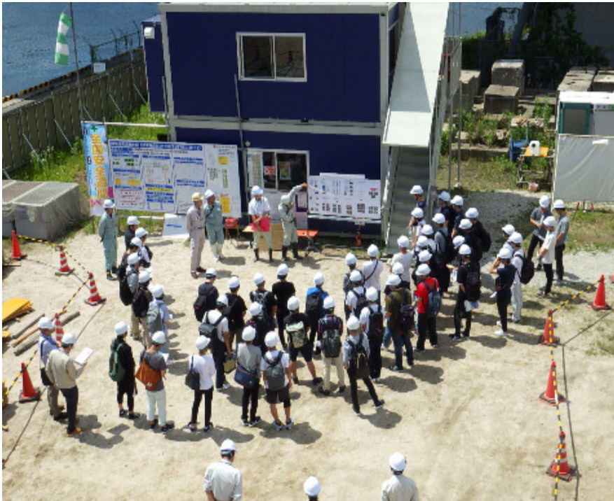
広島工業大学 工学部 環境土木工学科のみなさんの現場見学

広島はつかいち大橋東詰交差点から広島はつかいち大橋西詰交差点西までの1.3kmについて、平成29年10月より平成30年代中頃を目指して施工中です。