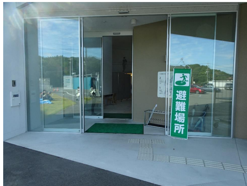
避難所の受付設置・避難所開設の案内例 (熊野東防災交流センター)