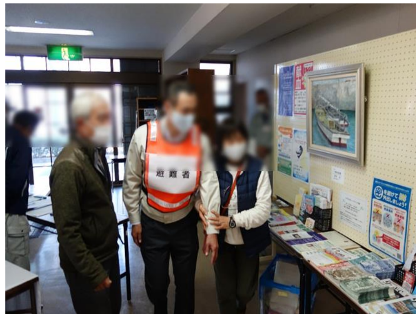
避難所の受付・誘導例 (中通地域交流センター)