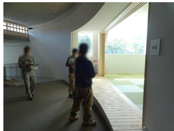
避難者対応・施設の安全点検例 (熊野東防災交流センター)