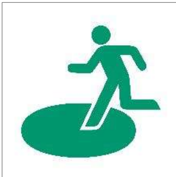
指定緊急避難場所を示す記号