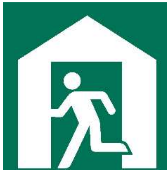
指定避難所を示す記号