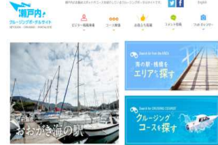
係留施設、周辺観光施設、クルージングコース施設間の移動距離・時間などの情報提供