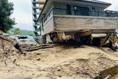
広島市西区田方(御幸川支川)