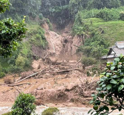
広島市安佐南区伴中央(奥畑川支川)