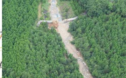
北広島町本地(広能川)