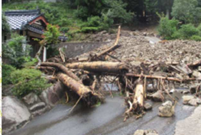
北広島町南方(木次川)