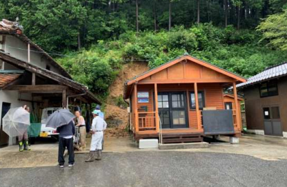
庄原市平和町(平田)