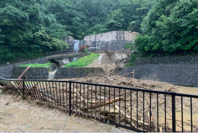
広島市安佐南区相田(安川支川54)