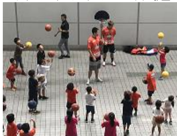
エアポートスポーツスクール バasket教室