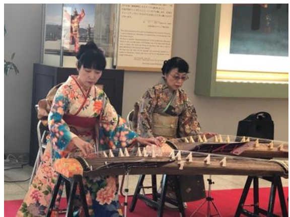
新春ロビーコンサート