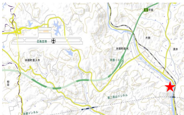
地理院地図を基に作成

湧水地は、戦国武将の小早川隆景が居城とした国史跡新高山城跡と、水量豊かな沼田川の間位置しており、まろやかな軟水が地下70mから湧き出ています。ミネラル成分のバランスもよく、コーヒーやお茶の味・香りが一段と引き立つと評判で、連日多くの方が汲みに訪れています。