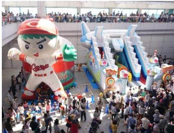
ソラミィフェスタ