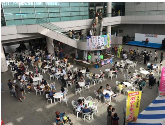
ひろしま空の日ふれあい秋まつり