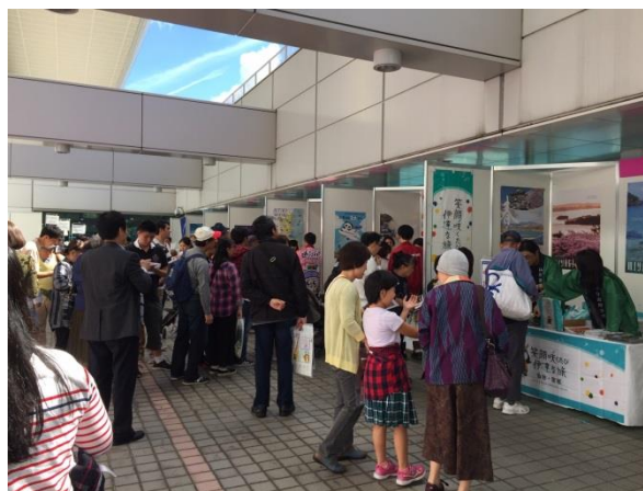
ひろしま空の日2018 ふれあい秋まつり（エアポートフェスタひろしま2018）の様子

広島空港に親んでもらい、より一層の広島空港の活性化と利用促進を図るため、「ひろしま空の日 2019 ふれあい秋まつり」が実施されます。