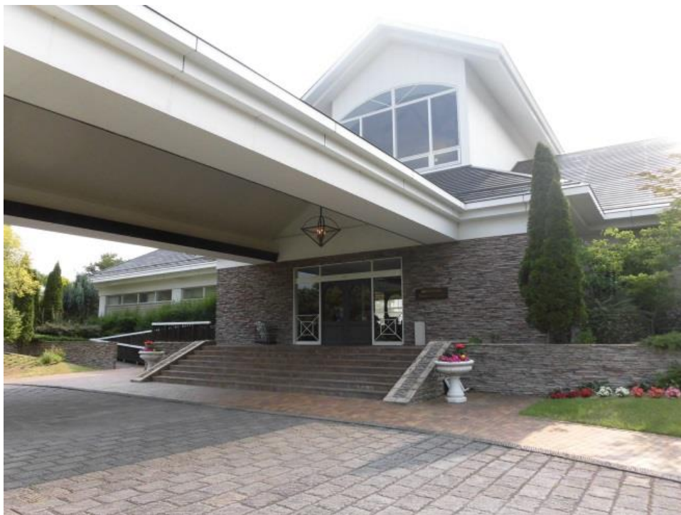
フォレストヒルズガーデン