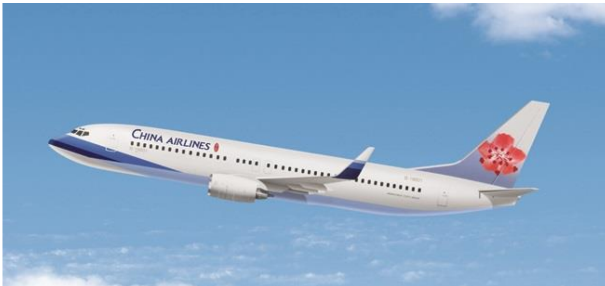
チャイナエアライン機体

「広島～台北線」は、デイリー運航されており、広島からの台湾渡航に使いやすいダイヤに設定されています。また、台湾の桃園空港での乗り継ぎにチャイナエアラインが誇る多様なフライトネットワークを活用すれば、東南アジア方面などへの渡航にも便利です。