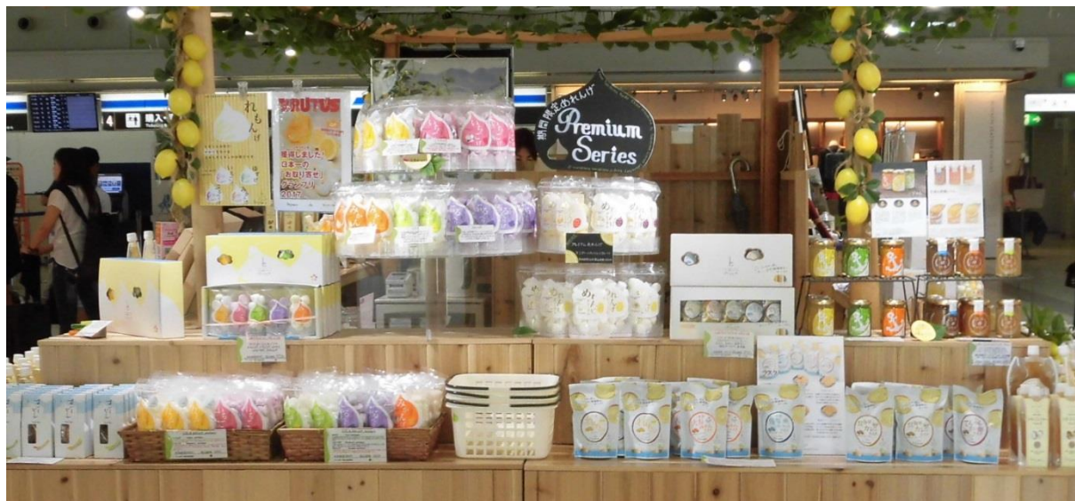
広島空港ターミナルビル2階 とびしま柑橘工房