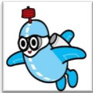
広島空港マスコットキャラクター ソラミ 広島空港①スクエア通信の取材者

このコーナーでは、広島空港に関わる人の現場の声を紹介します。ここに掲載されている内容は、広島空港①スクエア通信取材班が広島空港で働く複数の方々にインタビューして、こぼれる本音をまとめたものです。多様な意見の1つではありますが、貴重な言葉と受け止め①スクエア通信では取り上げさせていただきました。