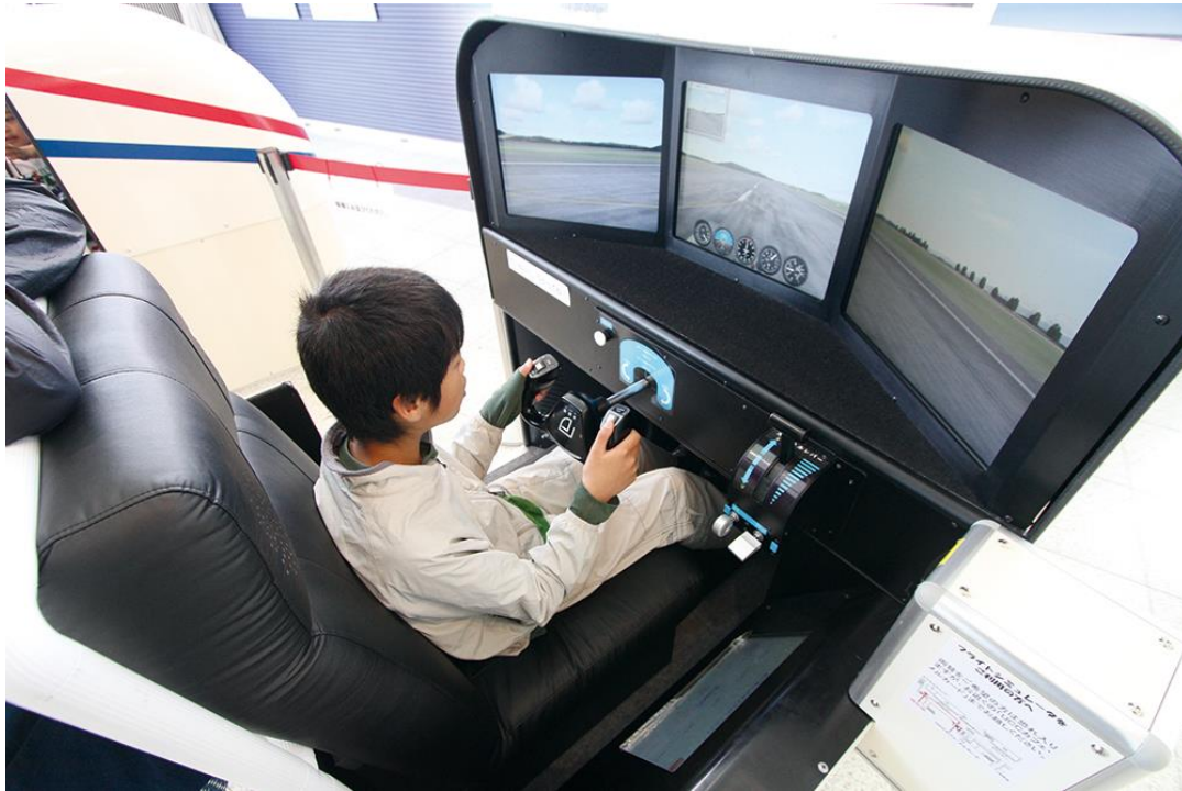
広島空港ターミナル2階 フライトシュミレーター