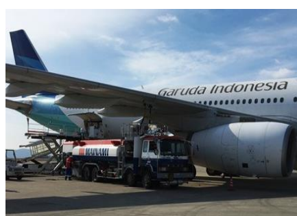
マイナミ空港サービス株