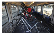
サイクルトレインの運行