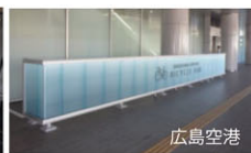
セルピットの設置

広島県には、瀬戸内海の多島美、中国山地の豊かな自然をはじめとした、海・山・川・谷・平野・盆地などの多彩な自然があり、エリアごとにまったく異なる風景を楽しむことができます。また、それぞれのエリアには、独特のグルメや歴史を感じるスポットなどもあり、自由に移動できるサイクリングには最適です。