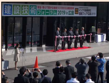
大勢の来場者に囲まれた開会セレモニー