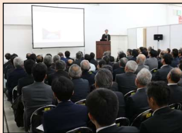
来場者で満席となったセミナー会場