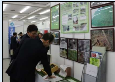
パネルや実物を用いて技術概要などを説明する出展者