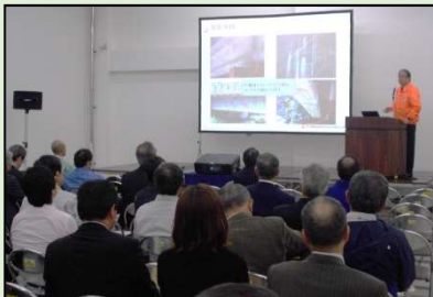
活用効果などをPRする出展者