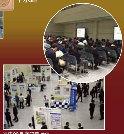
平成29年度開催状況

令和元年 とき 11/26火・27水 ●1日目:10:00~16:30 ●2日目:9:30~15:30 会場 広島産業会館東展示館 (広島市南区) 入場無料