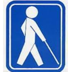
盲人のための 国際シンボルマーク