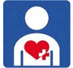
ハートプラスマーク