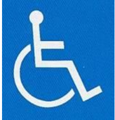
障害者のための 国際シンボルマーク

障害には、身体内部や聴覚障害など、外見ではわからないものもあるため、障害者が誤解を受けたり、我慢を強いられることもあります。 これらのマークを見かけたときは、御理解、御協力をお願いします。