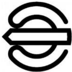
ようやくひっき 要約筆記 シンボルマーク