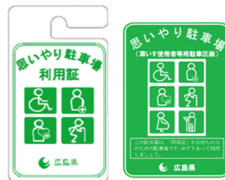
ひろしまけんおも 広島県思いやり ちゅうしゃじょうりょうしょう 駐車場利用証