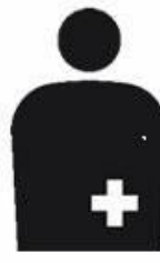
オストメイトマーク