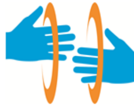
しゅわ 手話マーク