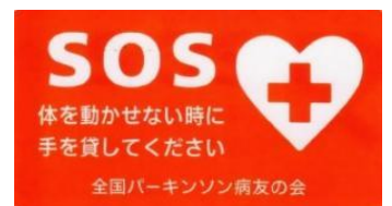
びょう パーキンソン病 えすおーえす SOSカード