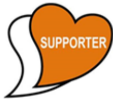
あいサポートシンボル