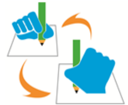
ひつたん 筆談マーク