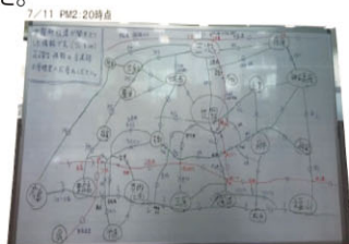
道路情報の手描きマップ （道の駅世羅）