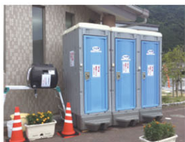
断水に伴う仮設トイレの設置 （道の駅クロスロードみつぎ）