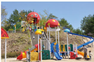
わんぱくトマトガーデン

現在大人気の産直売場の規模を拡大します。また、フードコートを新設し、新しいメニューも提供します。先行してオープンした「わんぱくトマトガーデン」とあわせて、ご家族で1日中楽しめる道の駅となります！