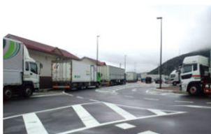
大型車で満車（7/7撮影） （道の駅みはら神明の里）

豪雨災害では県内各地で道路が寸断され、道の駅には道路情報を求める電話が殺到し、多くのドライバーが一時的に避難されました。道の駅では、臨時駐車場の開放や（世羅）、おにぎりの配布（クロスロードみつぎ）、仮眠スペースの提供（みはら神明の里）などの支援が行われました。