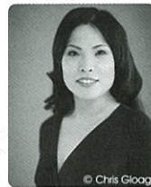
[ソプラノ] 中村恵理

ロンドン響、サンクトペテルブルク・フィル、ニュージーランド響などに定期的に客演。国内では全国各地のオーケストラはもとより、サイトウ・キネン・オーケストラ、水戸室内管弦楽団にも客演。またオペラ分野でも、シドニー歌劇場でのデビュー以来、数々のプロダクションを成功に導いている。京都市交響楽団常任指揮者兼ミュージック・アドバイザー。札幌交響楽団友情客演指揮者。東京音楽大学指揮科教授。