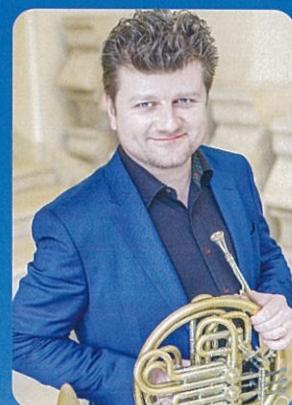
[ホルン] ラデク・バボラーク