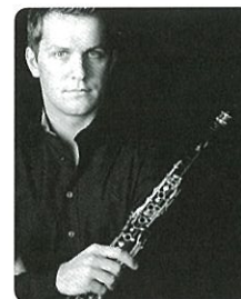
[クラリネット] ラズロ・クタイ ミュンヘン・フィル首席