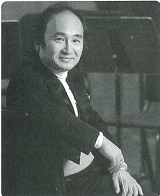
[指揮] 広上 淳一

東京生まれ。東京音楽大学指揮科に学ぶ。第1回キリル・コンドラシン国際指揮者コンクールに優勝し、国際的な活動を開始。これまでノールショピング響首席指揮者、日本フィル正指揮者、ロイヤル・リヴァプール・フィル首席客演指揮者、リンブルク響首席指揮者、米国コロンバス響音楽監督を歴任する傍ら、フランス国立管、ベルリン放送響、ウィーン響、コンセルトヘボウ管、モントリオール響、イスラエル・フィル、