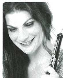
[オーボエ] クララ・デント ベルリン放送響首席

国際平和文化都市「広島」を拠点に活動する中四国地方を代表するプロ・オーケストラ。2017年からは下野竜也が音楽総監督に就任。秋山和慶(終身名誉指揮者)、クリスティアン・アルミンク(首席客演指揮者)、フォルクハルト・シュトイデ(ミュージック・パートナー)、マルタ・アルゲリッチ(広響「平和音楽大使」)らと共に、音楽による平和のメッセージを発信している。「文化対話賞(ユネスコ)」「広島市民賞」などを受賞。