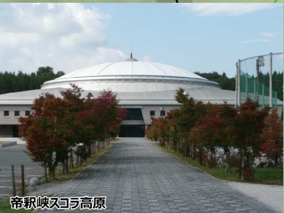
帝釈峡スコラ高原