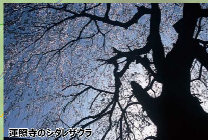
蓮照寺のシダレサクラ