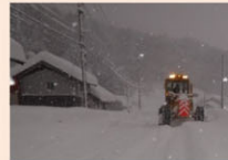
冬期交通の安全確保 (住民の生活を守る除雪作業)