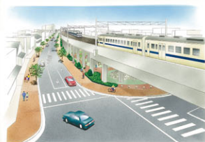
連続立体交差化のイメージ