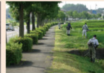
地域でのアダプト活動 (地域共同での道路除草)