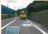
日々の道路パトロール (発見した穴の舗装補修状況)

道路の草刈りや除雪等を実施するとともに、日々の道路パトロール等により、穴ぼこ、倒木、落石等の異常を早期に把握し、適切な維持管理を実施します。