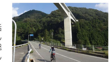
県内各地でイベントの開催 (やまなみ街道サイクリングロード)

無料化開始前 支払に伴い料金所で渋滞発生 無料化開始後 ノンストップで快適なサイクリング