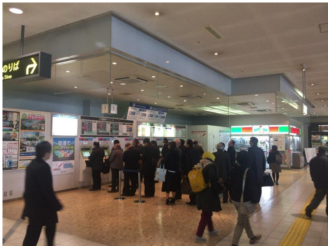
現在の広島空港のターミナルビル内のバス券売機の混雑状況

※PASPY・・・バス・路面電車、アストラムライン、船舶、ロープウェイ等の広島の主な公共交通機関で利用可能な交通系ICカード(現在は、ICOCA(JR西日本)のみPASPYエリアで利用可能)