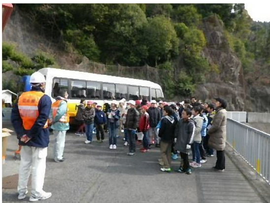
無事、見学を終えて解散前の集合