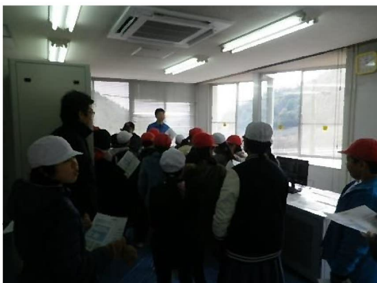
施工業者から更新機器概要等の説明