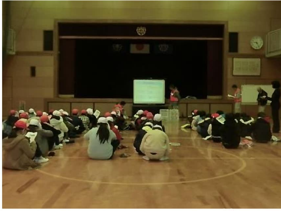
県職員によるダムの基礎知識の説明