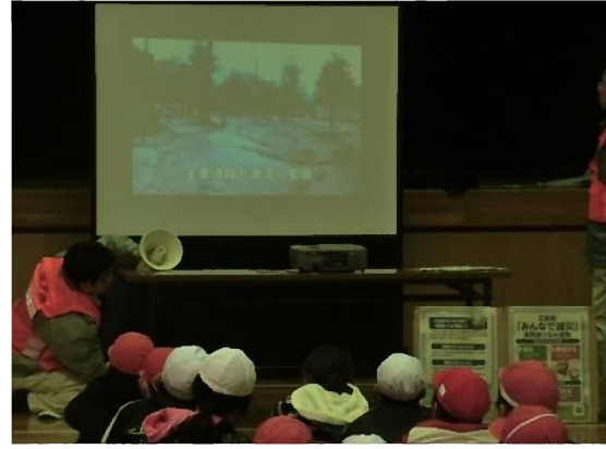
DVD等による災害・防災等の説明