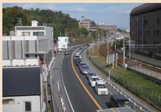
宮島口付近(廿日市市)渋滞状況