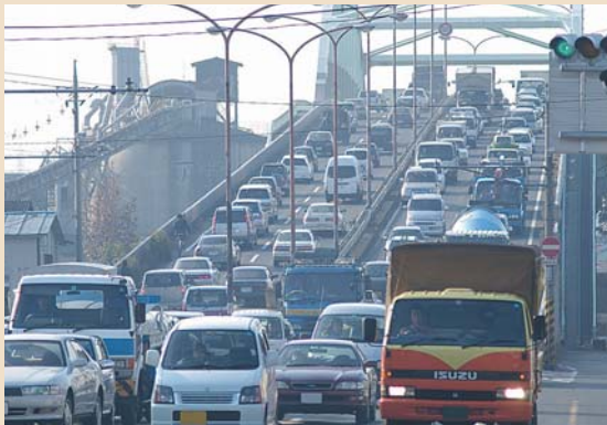
入江大橋(福山港：福山市)渋滞状況

新たな活力を生み出すための、経済成長を支える産業インフラの強化が必要となっています。また、県内の豊かで魅力ある観光資源を活かし、観光振興による交流人口を拡大するため、観光産業への支援が必要となっています。