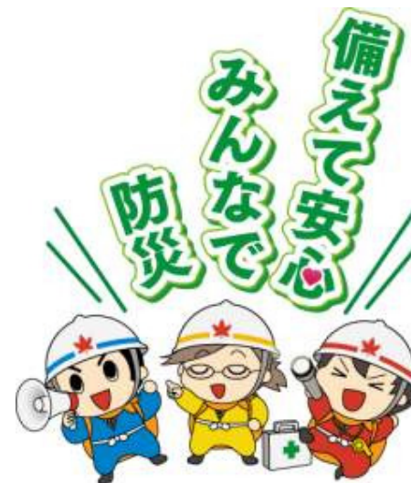
防災意識の高揚を図っているタスケ三兄弟 左からコウスケ, キョウスケ, ジスケ