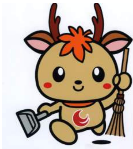
広島県アダプト制度マスコット キャラクター 「アダピィ」