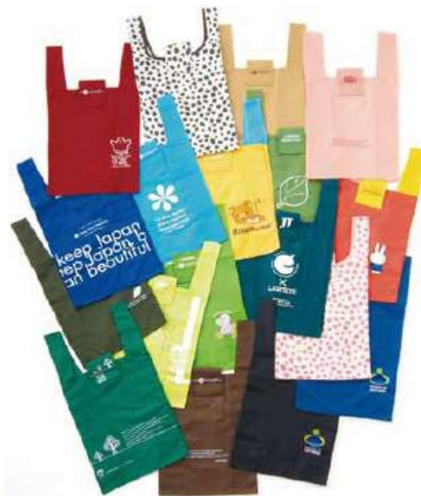
▲これまでに作成したコンビニecoバッグ(一部)