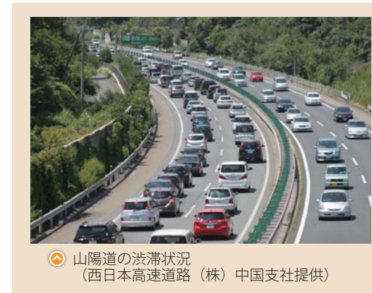
◎ 山陽道の渋滞状況