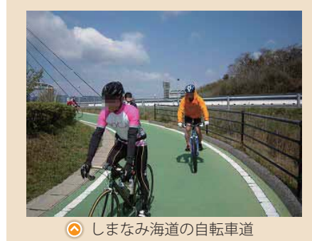
◎ しまなみ海道の自転車道