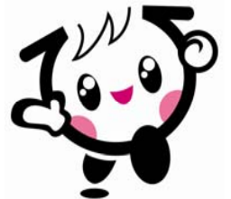
広島県の子ども元気いっぱいキャラクター イクちゃん