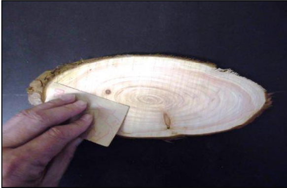
① 紙やすりで表面を磨く。 ※凹凸があると、絵や文字が書きにくいので、できるだけなめらかにする。