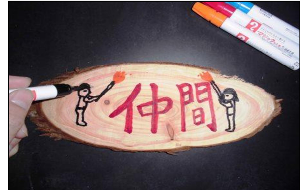
③ 絵の具やマジックなどで着色する。