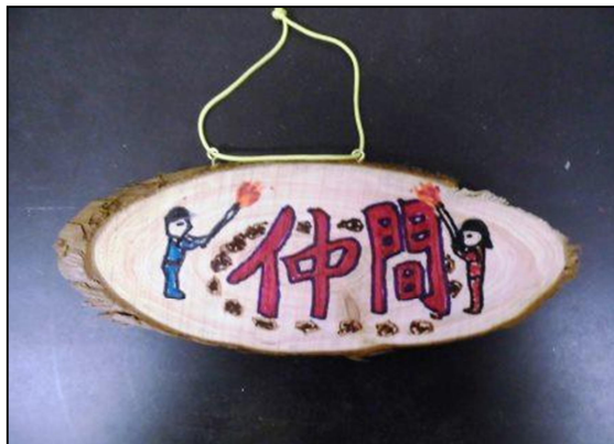
⑤ 組みひもをむすぶ。

絵の具は、輪切り材に吸収されやすいので、少し濃いめに使用した方が良いです。(使用用途による) また、絵の具を乾かす時間が必要です。日程を工夫してください。