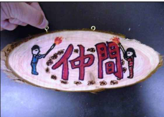
④ ヒートンを取り付ける。 ※押しながらねじ込む。