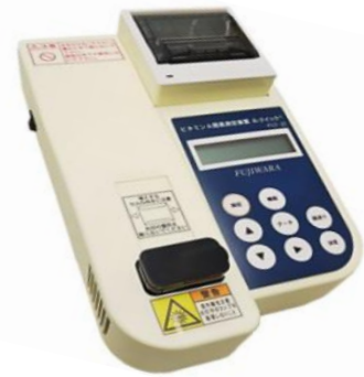
ビタミンA簡易測定器 「A-クイック」