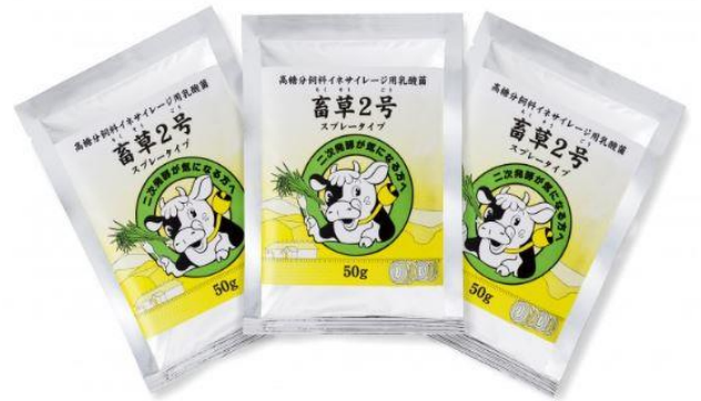
発酵飼料用乳酸菌製剤 「畜草2号」