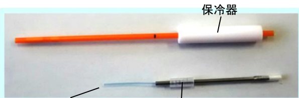
ガラス化胚簡易取扱器具 「ビトラン-7」