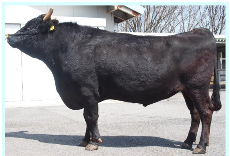
基幹種雄牛 「花勝百合」