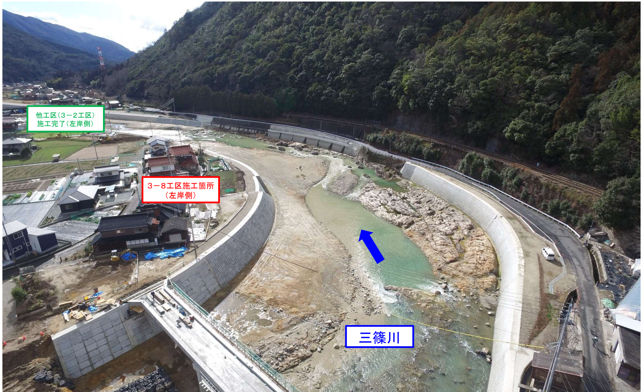
写真③（施工箇所付近全景）