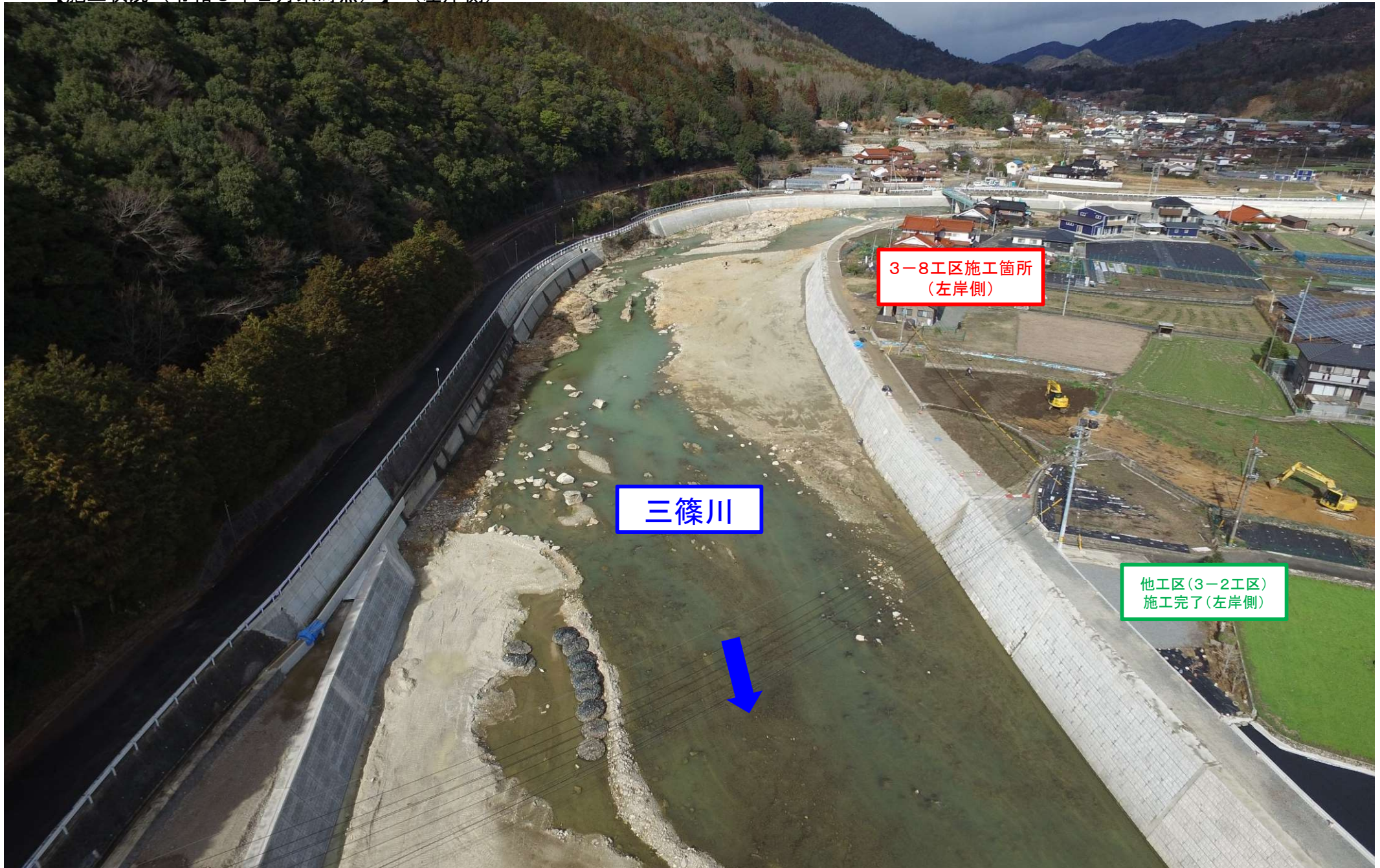
写真②（施工箇所付近全景）