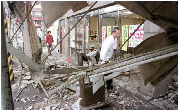
広島市西区 広電 西広島駅付近