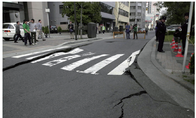
広島市中区 平和大通り付近

Yahoo!防災速報アプリの「防災タイムライン」なら 津波による浸水区域など、自宅の危険度が分かります。