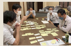
グループワーク情報交換

新たな建築業界のニーズを学び 発注者・設計者に選ばれる 施工者・木材供給者になる