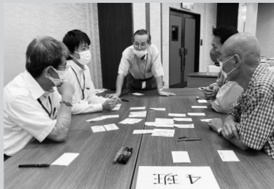
設計者との意見交換

1970生まれ。大学卒業後、建築設計事務所勤務を経て青年海外協力隊に参加。帰国後、木造建築の設計活動展開。2005地域産木材の活用と森林保全に取り組む「加古川流域森林資源活用検討協議会」設立に参加し、事務局代表を務め、2009NPO法人サウンドウッズとして法人化し現在に至る。木造施設の発注支援、設計支援、木材利用と森づくりのつながりを解説するセミナー講師やコーディネートを全国で展開中。