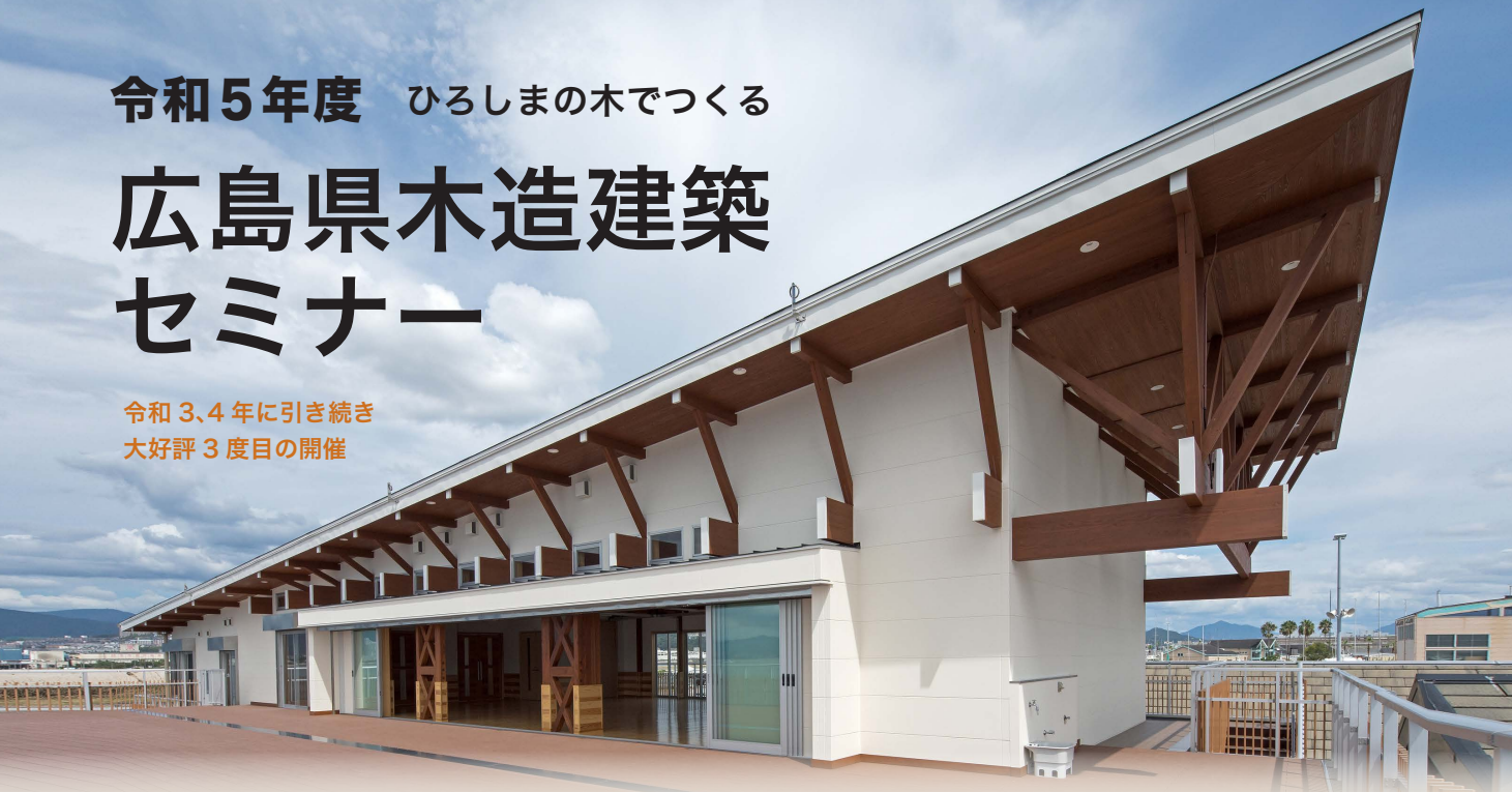
広島県観音地区観音マリーナ管理棟 画像提供：株式会社酒井建築コンサルタント