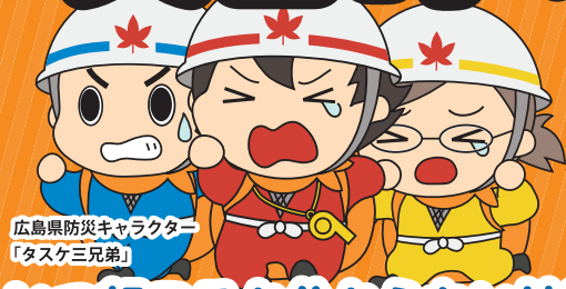
広島県防災キャラクター「タスケ三兄弟」