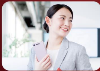
働きがいのある仕事 自分の持つスキルや特性を活かして活躍できる