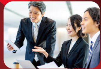
働きがいのある組織 自分の能力や会社への貢献度を正しく評価してくれる

本イベントでは「 大学・短大・専門学校等の全学年の学生 」と「 教職員 」をご招待します！