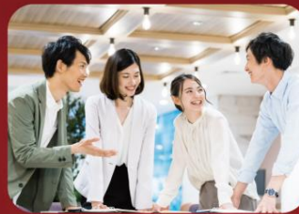
働きがいのある職場 職場のコミュニケーションが円滑で助け合えることができる