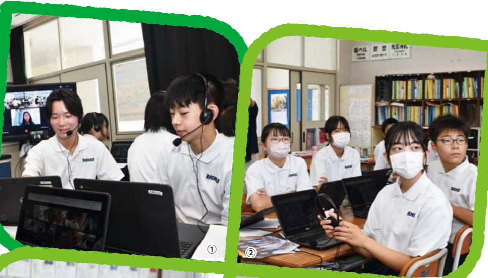
①② 韓国の中学生とオンライン英会話 (本郷中学校)