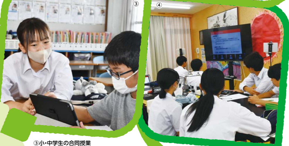
③ 小・中学生の合同授業 (天応学園)