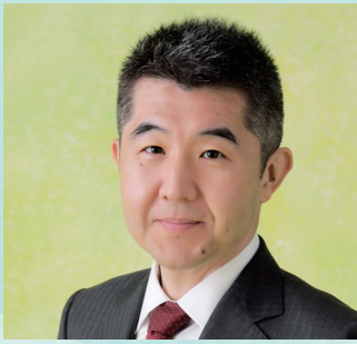
広島大学大学院 医系科学研究科 小児科学 教授