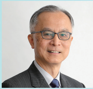
国立成育医療研究センター 理事長

1999年 徳島大学医学部卒業。広島大学医学部付属病院、広島赤十字・原爆病院、中国労災病院、その後、広島大学病院医員。2007年に学位取得、2010年より米国ロックフェラー大学ポスドク。2013年広島大学に帰学し、助教・講師を経て2020年より現職。感染免疫、小児血液・がん、小児内分泌を専門分野とし、遺伝学を背景として臨床・研究に従事。