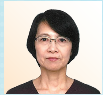
広島市立舟入市民病院 副院長

1978年東京大学医学部卒業。2000年より同大学小児科教授、副院長を経て、2012年より国立成育医療研究センター理事長。2013年東京大学名誉教授。2014年American Pediatric Society名誉会員。現在、子ども環境学会会長、日本保育協会理事、ベネッセこども基金理事長、中山人間科学振興財団理事長を歴任。