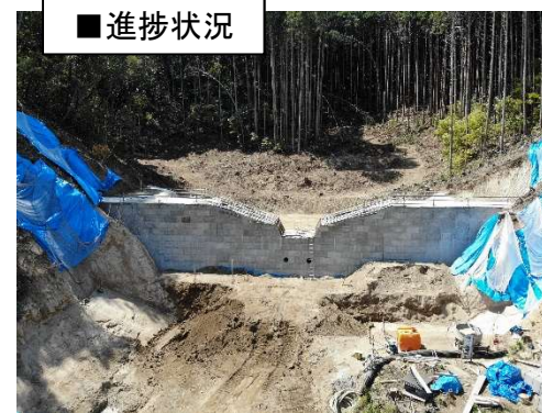
工事完了（令和5年4月1日）