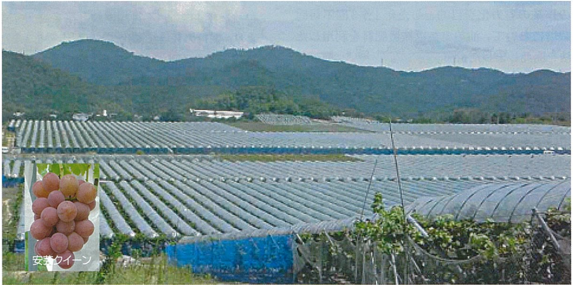
安芸クイーンなど新品種の普及が期待されるブドウ団地