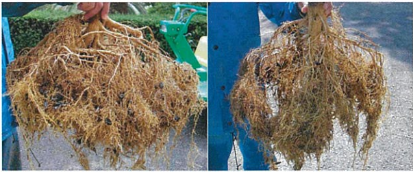
かん水区 過乾燥区 8月の乾燥による根量の減少