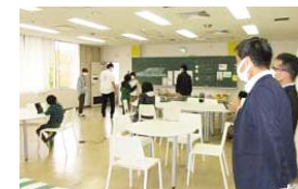
教育委員によるSCHOOL "S"訪問