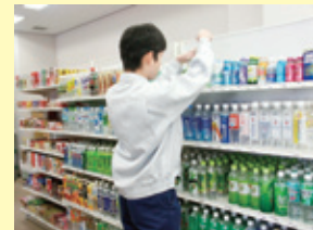
広島障害者職業能力開発校での訓練