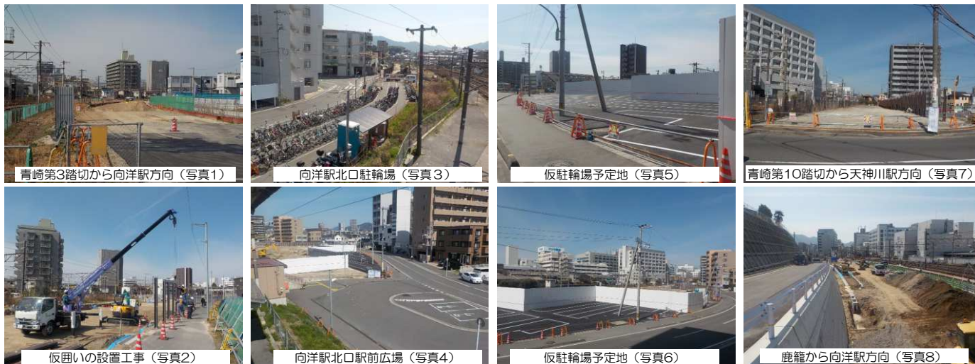
広島市東部地区連続立体交差事業 計画図