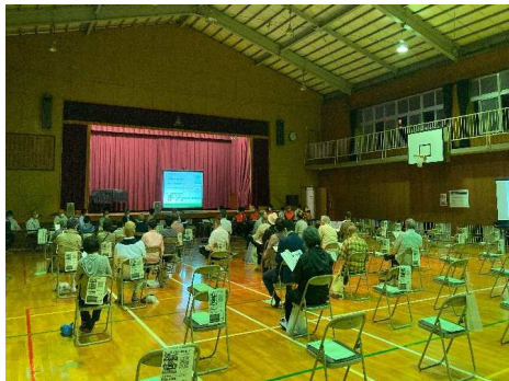
＜広島市青崎地区 説明会実施状況＞ 令和2年10月15日(木) 青崎小学校