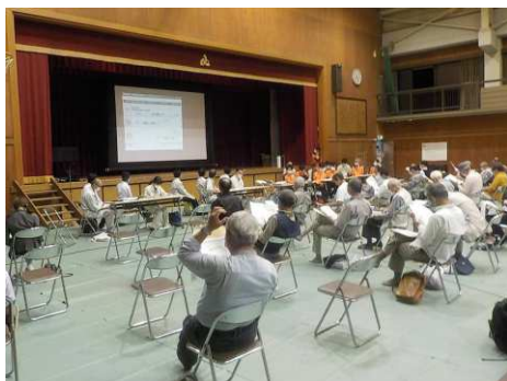
＜府中町地区 説明会実施状況＞ 令和2年10月12日(月) 府中南小学校