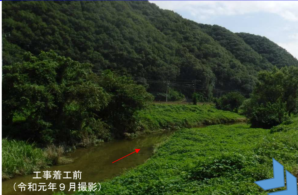
工事着工前 (令和元年9月撮影)