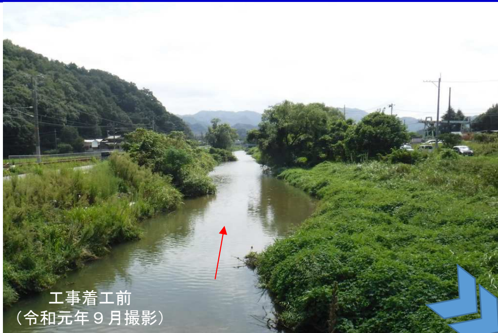
工事着工前 (令和元年9月撮影)