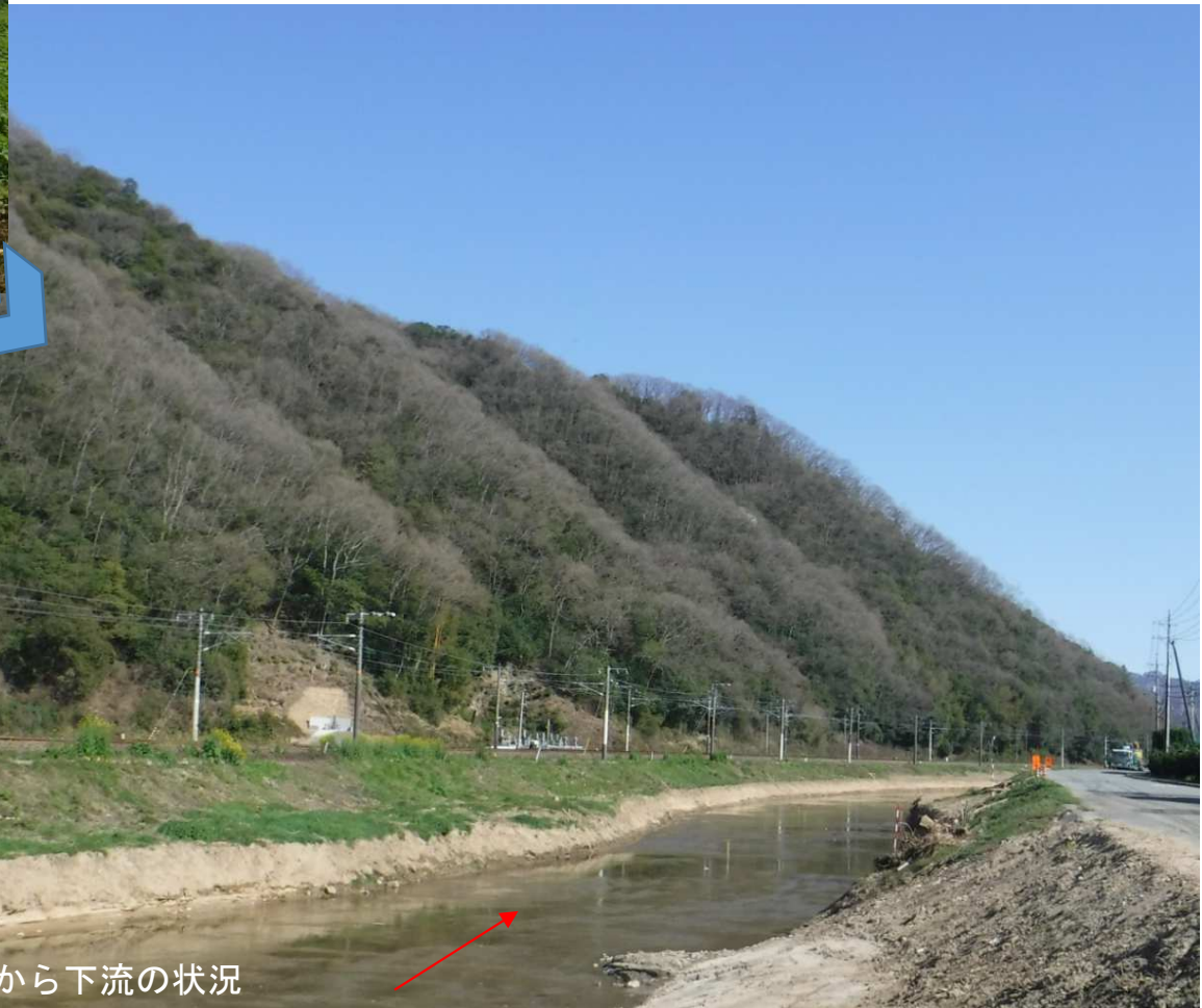
1k300付近から下流の状況