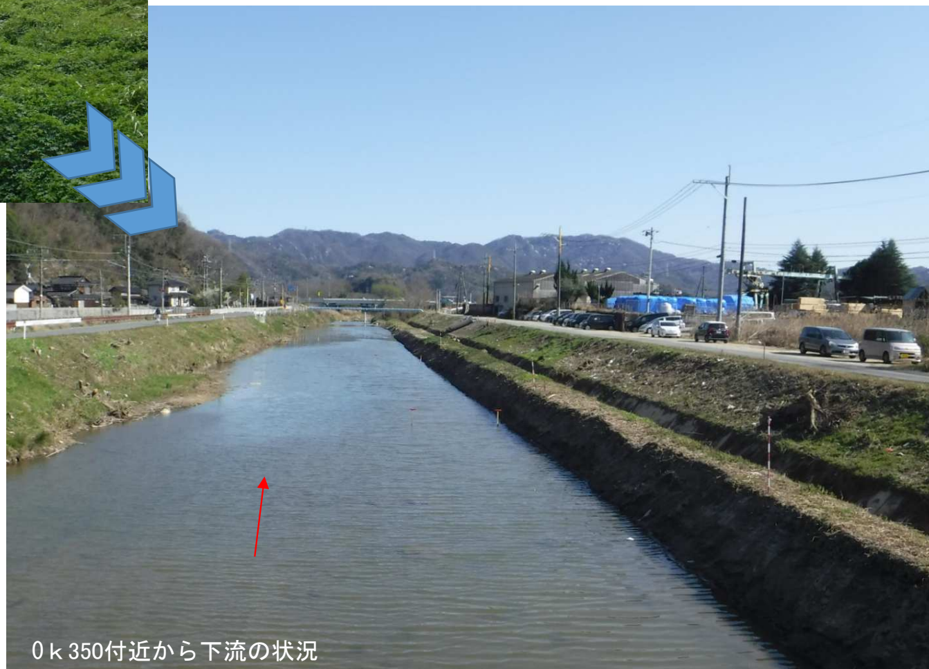
0k350付近から下流の状況