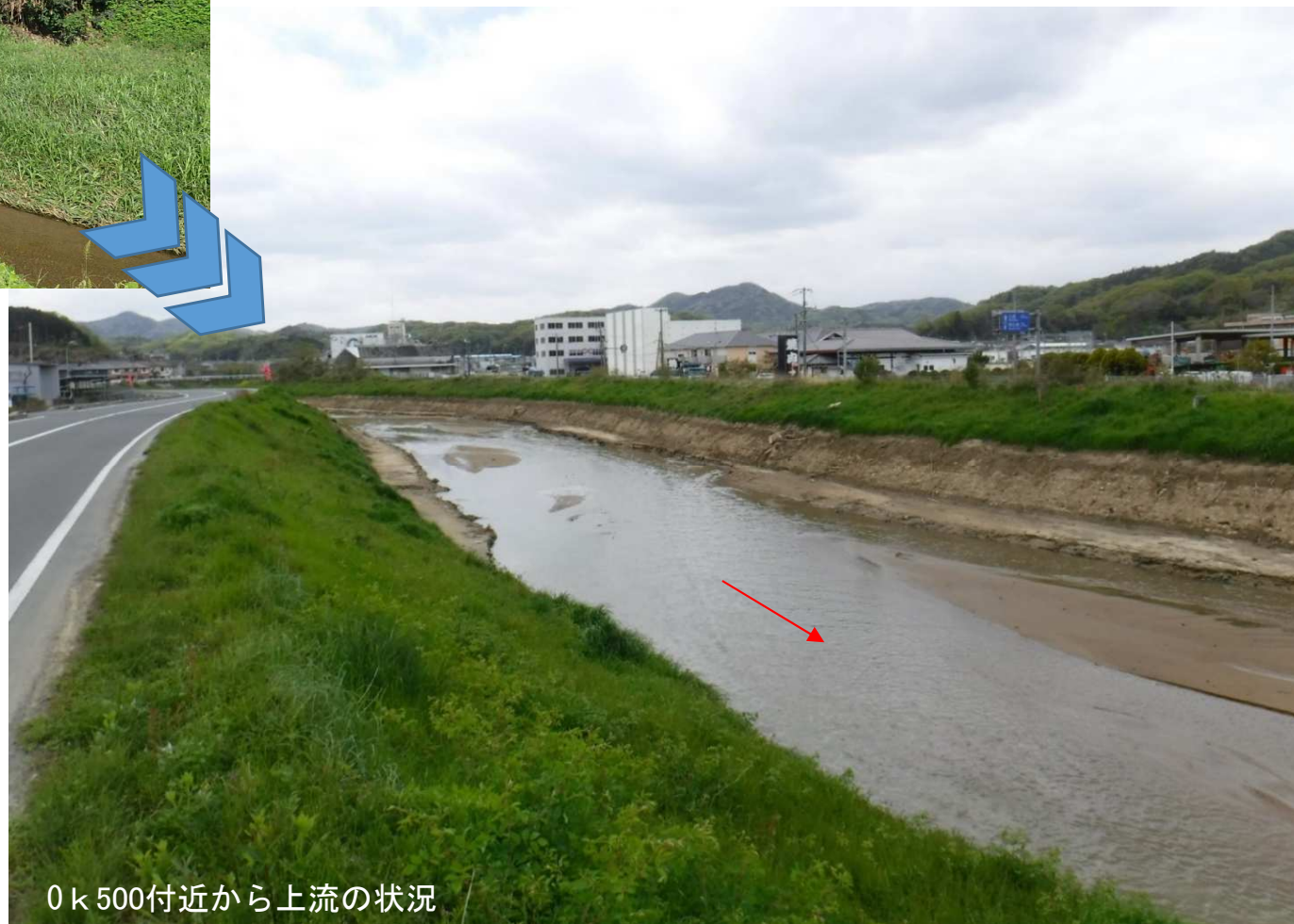
0k500付近から上流の状況