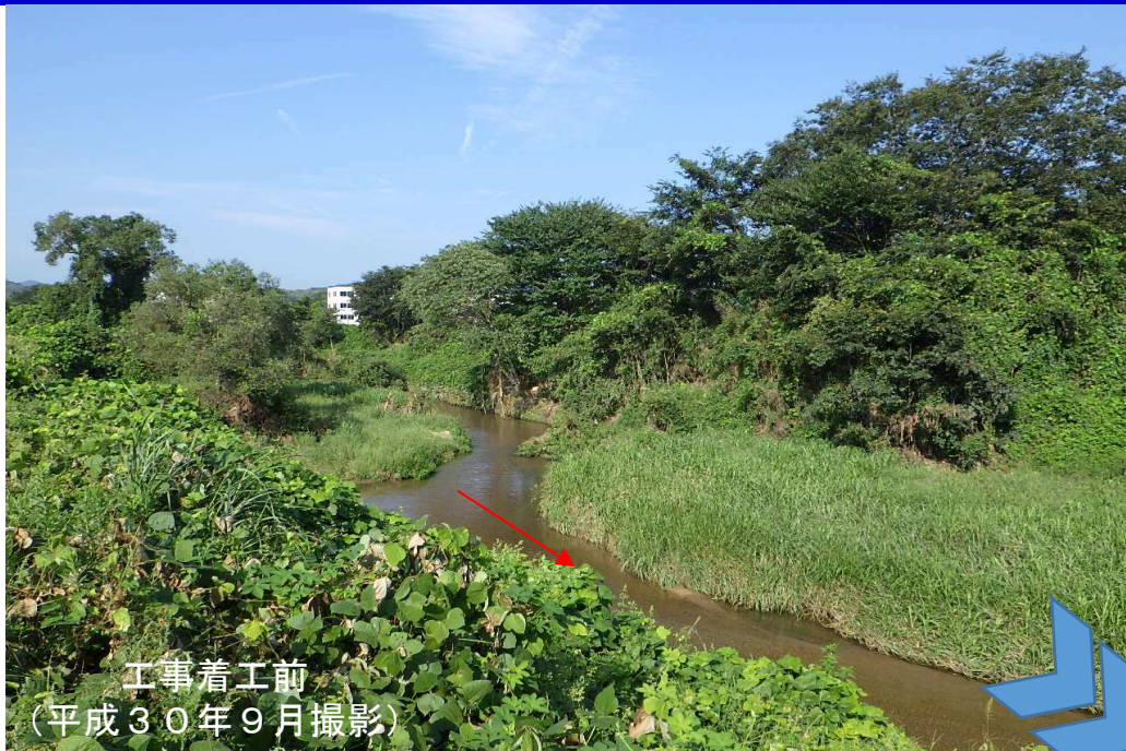
工事着工前 (平成30年9月撮影)