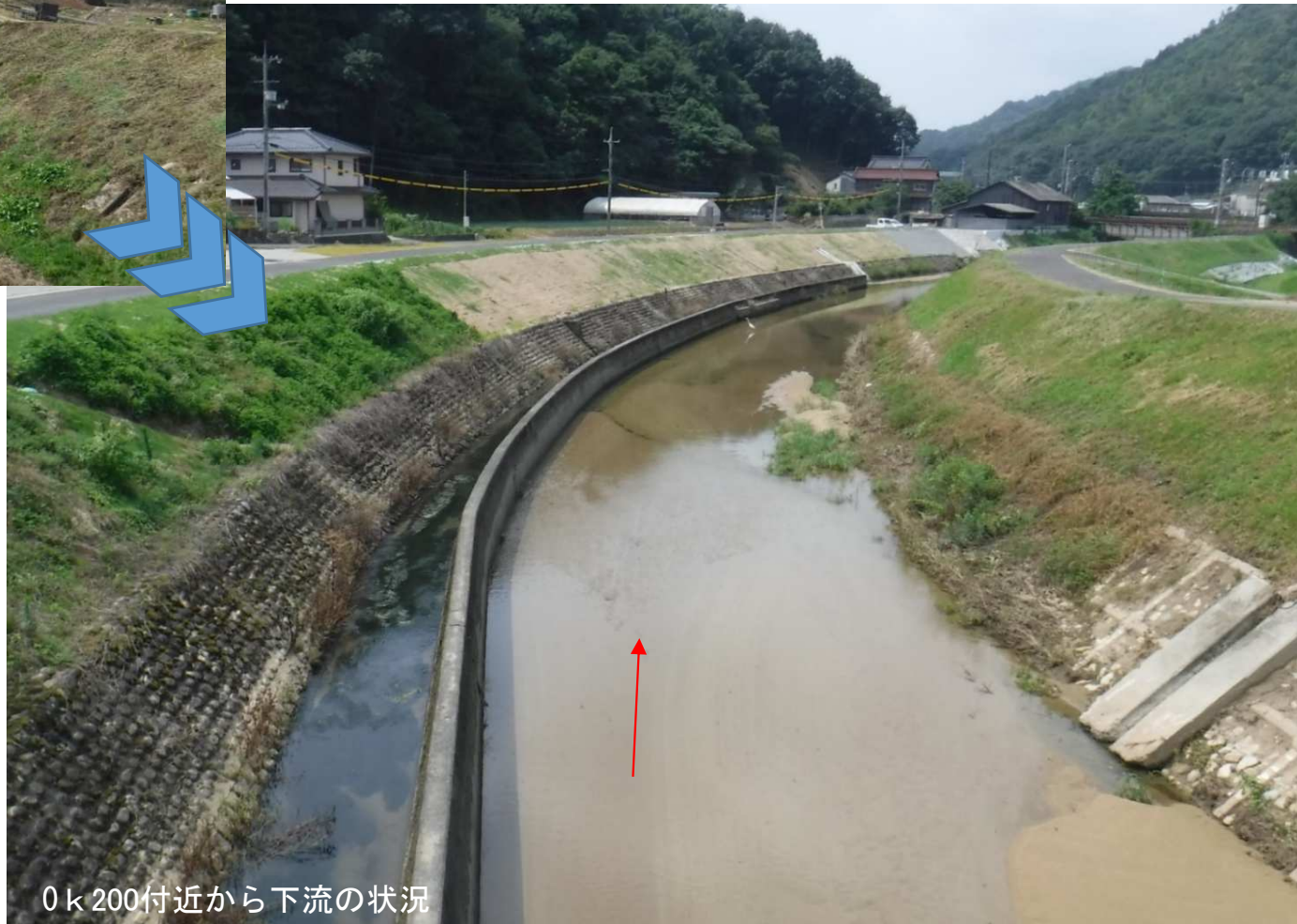
0k200付近から下流の状況