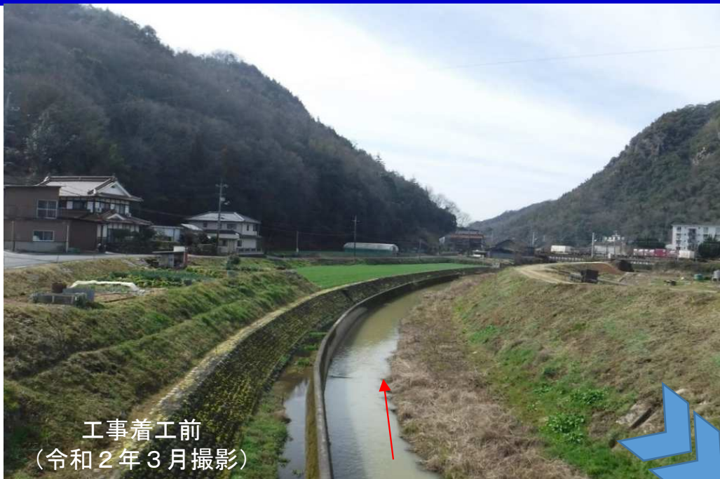
工事着工前 (令和2年3月撮影)