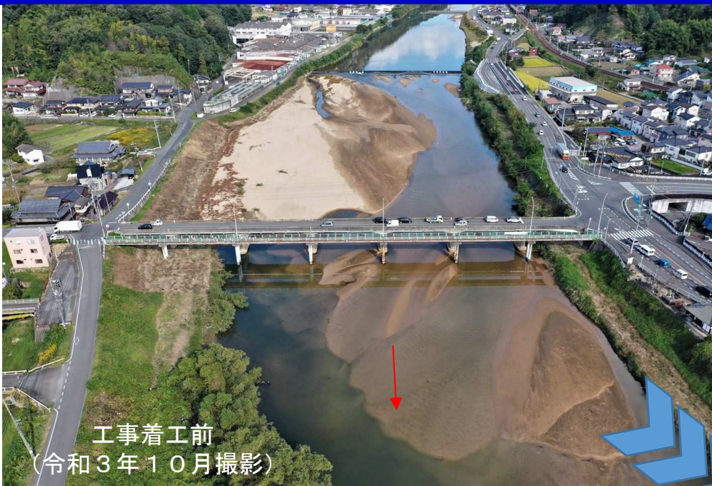
工事着工前 (令和3年10月撮影)