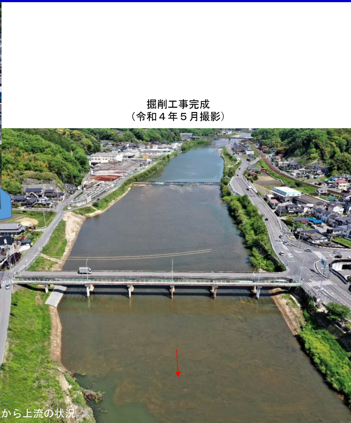
掘削工事完成 (令和4年5月撮影)