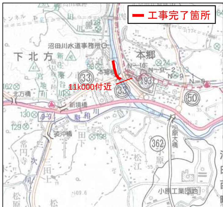
11k000付近から上流の状況