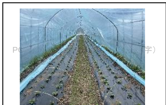
さつまいもの苗を育苗中