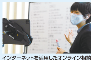
インターネットを活用したオンライン相談

特別支援教育の視点に立った授業づくり、障害のある児童生徒等への支援方法、個別の教育支援計画・個別の指導計画の作成・活用についての支援・助言等。