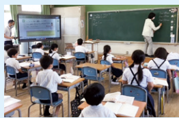
巡回相談では各学校等を訪問

学校を訪問し、授業への助言、児童生徒等の実態に応じた支援方法の提案やケース会議等。