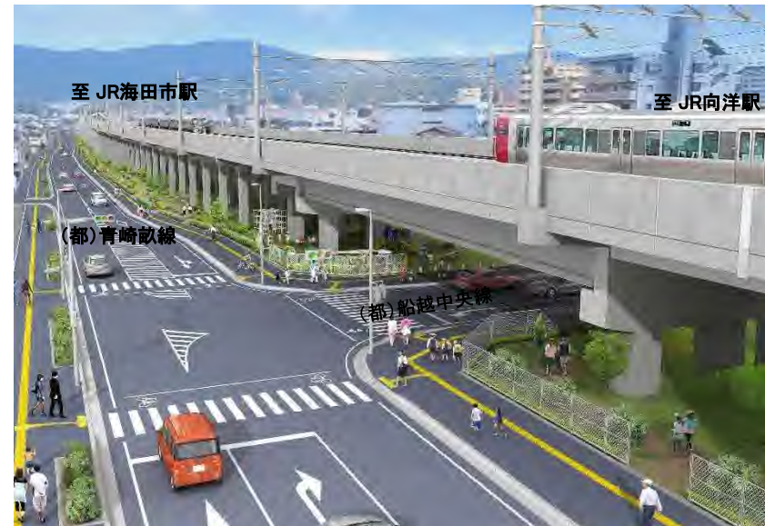
鉄道高架と関連街路の整備イメージ(広島市安芸区付近)